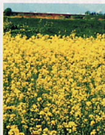
転作景観作物の花がある風景