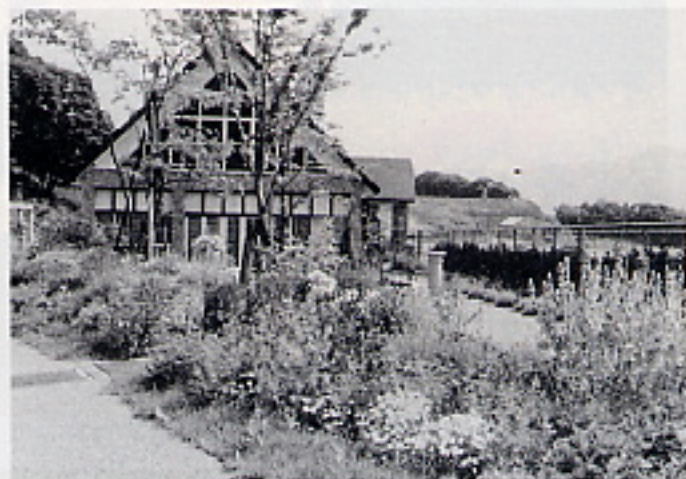
② 建物と花装飾が一瞥に写るような様相