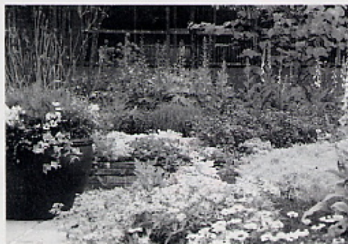
③ 庭の中で特に強調したいポイントの写真