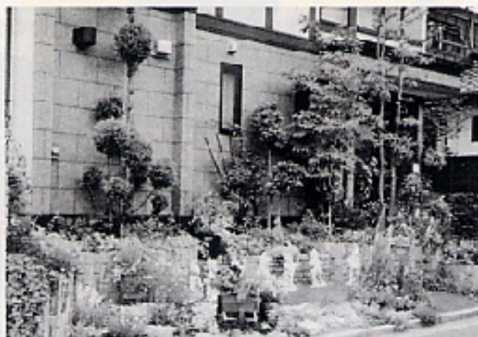
① 表から見えることが分かるような景観