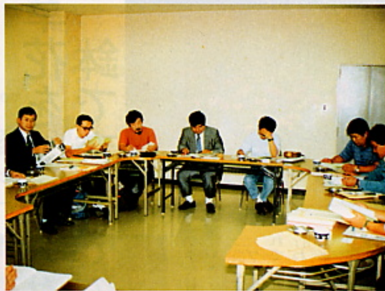
地域づくり調査隊事前研修