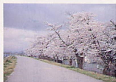
最上川堤防の桜並木