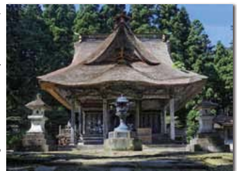
19番 笹野観音(米沢市・幸徳院)