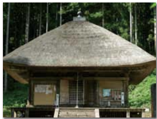
8番 深山観音(白鷹町・観音寺)

置賜三十三観音のお問い合わせ先 置賜三十三観音札所会事務局 21番小野川観音(宝珠寺) 電話 0238-32-2929