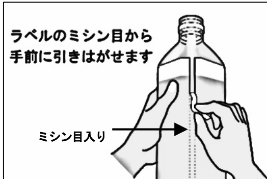
【ミシン目入りのラベル】