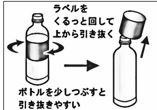
【伸び縮みするラベル】